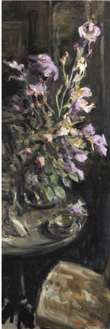
Les Fleurs de Leiris