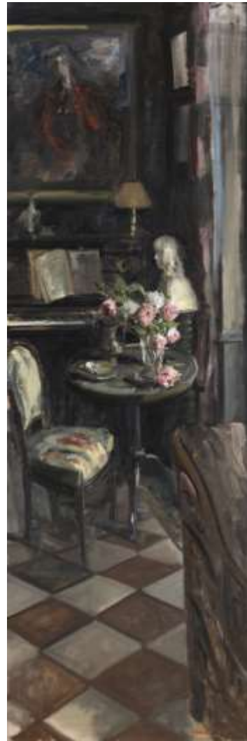
Les Roses de St Hilaire