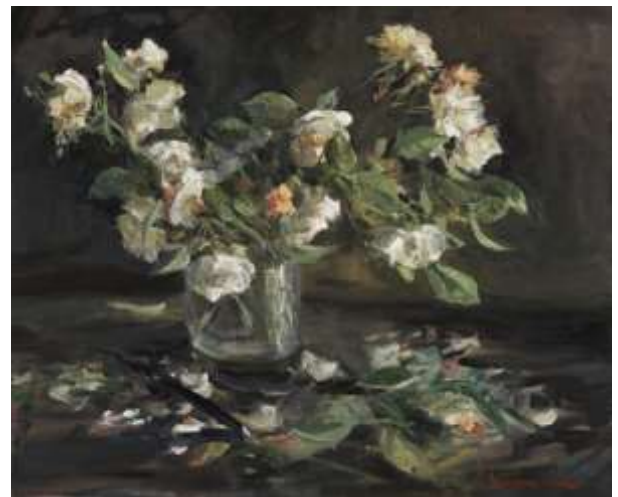
Les Roses de St Hilaire